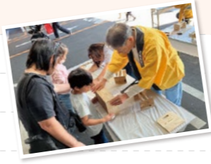
昨年もたくさんご来場いただきました!!