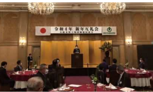
■堀川理事長からの挨拶

当協同組合の新年互礼会を1月14日(金)にホテル・アゴーラリージェンシー大阪堺において、多方面から来賓や組合員企業・友好企業、総勢68名出席のもと、開催した。