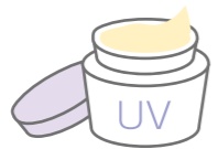
日焼け止めクリームは適量が大事

サングラスの色はなるべく薄い色を。色が濃いと瞳孔が開き、目の中に多くの紫外線がはいってしまいます。日焼け止めクリームの量は、顔には約1gほどのクリームを塗るようにしましょう。量が適量の半分だと効果は1/4ほどになってしまうようです。